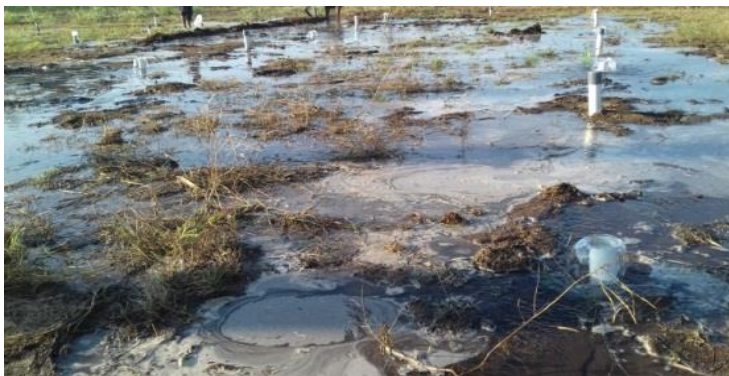
Gambar 1. Pengujian Irigasi Leb pipa

Berdasarkan hasil uji laboratorium bahwa lengas awal sebelum irigasi leb dilakukan, untuk tiap-tiap kedalaman 10 cm, 20 cm dan 30 cm diperoleh besarnya rata-rata 0,61%, 13,64% dan 14,34% dengan besar lengas rata-rata pertitik sampel tanah 13,53%.