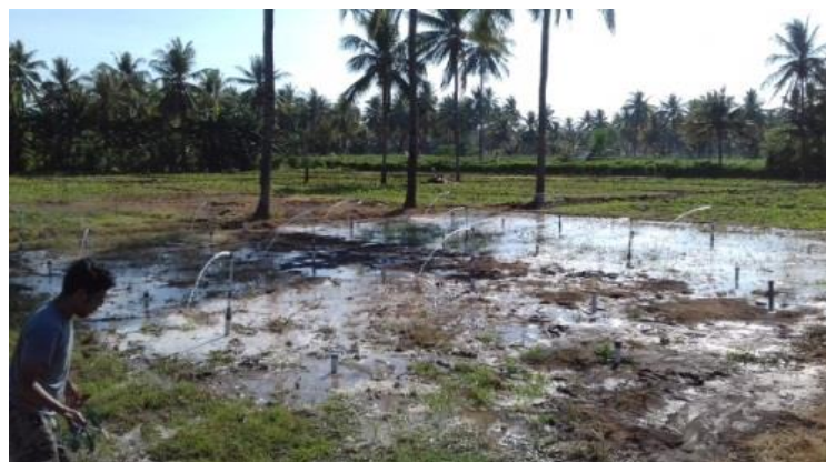
Gambar 4. Irigasi sprinkler mini

Berdasarkan hasil uji tanah di Laboratorium Mekanika Tanah dan Geoteknik Unram diperoleh besarnya lengas tanah awal sebelum dilakukan pengujian irigasi sprinkler mini untuk kedalaman tanah (h) 10 cm , w = 9,61%, h =20 cm , w = 13,64% dan pada h =30 cm , w =14,9% dengan rata-rata 12,7%. Berdasarkan hasil pengujian sprinkler mini seperti pada Gambar 4. diperoleh data hasil pengujian lengas tanah pada kedalaman sampel tanah 10 cm dapat dilihat pada Tabel 6.